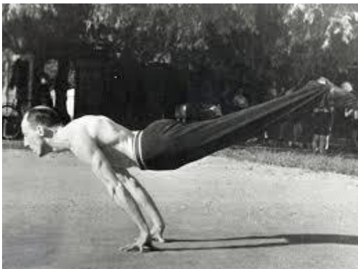
Olimpionik Leon Štukelj.

- statično ravnatežje, ki pride do izraza pri ohranitvi ravnatežnega položaja v mirovanju,