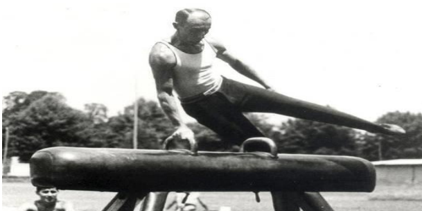
Olimpionik Leon Štukelj.

- dinamično ravnatežje, ki pride do izraza pri ohranitvi ravnatežnega položaja v gibanju.