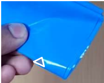
Slika 11 Izrežemo trikotnik