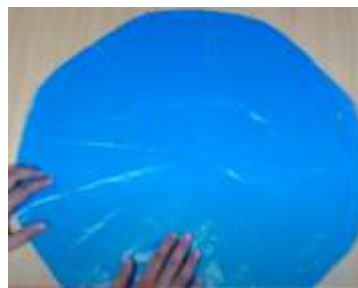
Slika 12 Razgrnemo