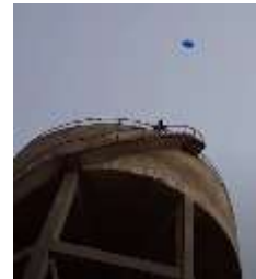
Slika 21 Met iz višine

Če nisi razumel navodil, si poglej navodila na spletni strani: