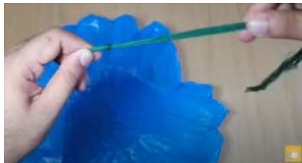
Slika 15 Skupen vozel na koncu vrvic