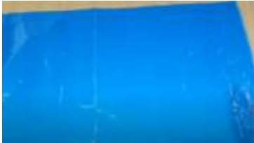
Slika 1 Vrečka v obliki pravokotnika