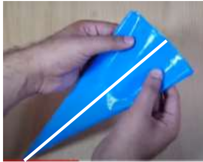
Slika 9 Kako prepognemo