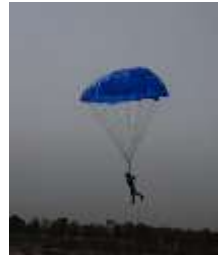
Slika 20 Padalo v zraku