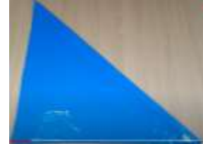
Slika 3 Odrezana vrečka