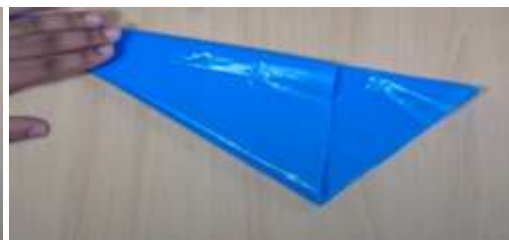
Slika 7 Prepognjeni trikotnik