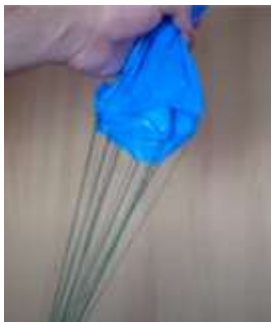
Slika 14 Vse vrvice so pritrjen