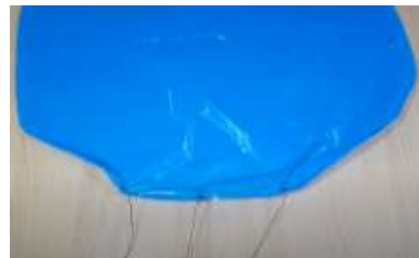
Slika 13 V luknje vstavimo vrvice in zavežemo