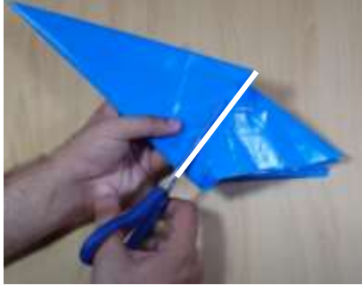
Slika 8 Odrežemo odvečni del