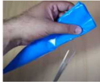
Slika 10 Prepognjeni del