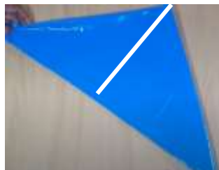
Slika 5 Še 1x prepogni trikotnik