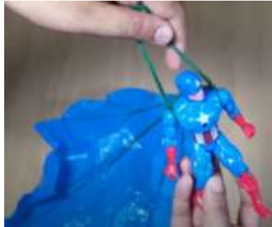
Slika 17 Vozel na drugi rami