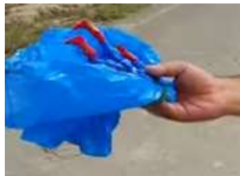
Slika 19 Mečemo padalo