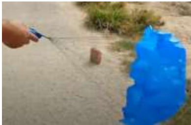
Slika 18 Zavrtimo padalo