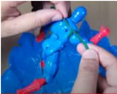
Slika 16 Vozel na eni ram